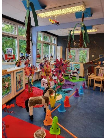
Prachtig aangeklede lokalen op Sinnehonk wachten op bezoek.