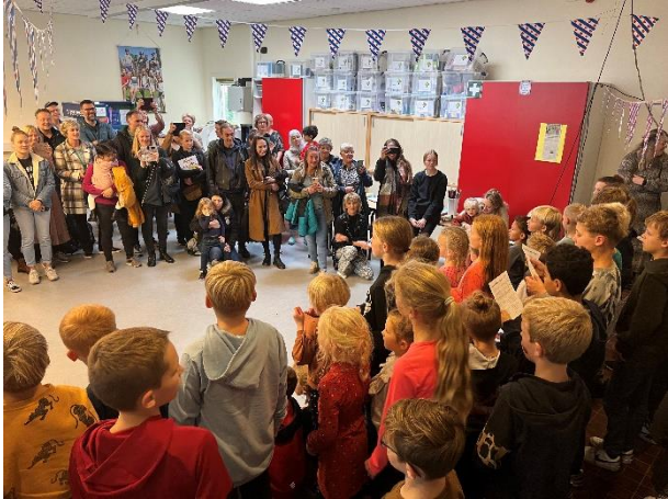
Samen Fryske liedjes zingen op Thrimwalda.

Fryske Wiken – De afgelopen week hebben de kinderen de Fryske Wiken op een originele wijze afgesloten. Leuk dat velen van u daarbij aanwezig en betrokken waren. Bedankt daarvoor! Voor mijzelf, en ongetwijfeld ook voor u als ouder, was het prachtig om te zien en te horen hoe de kinderen samen met hun juf of meester invulling hebben gegeven aan de Fryske Wiken. De kinderen hebben samen veel geleerd over de Friese taal en de Friese cultuur. Zeker iets om in de toekomst een vervolg aan te geven.