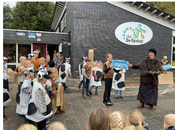
Toneelstuk over 'Tryn' op De Opstap.

Herfstvakantie – Jaaah, en dan is het alweer herfstvakantie. De tijd vliegt voorbij! Voor de kinderen en u als ouder, mede namens alle collega's van Fierkracht, een hele fijne herfstvakantie gewenst!