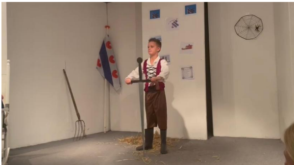
Toneelstuk over 'Grutte Pier' op It Kruired.